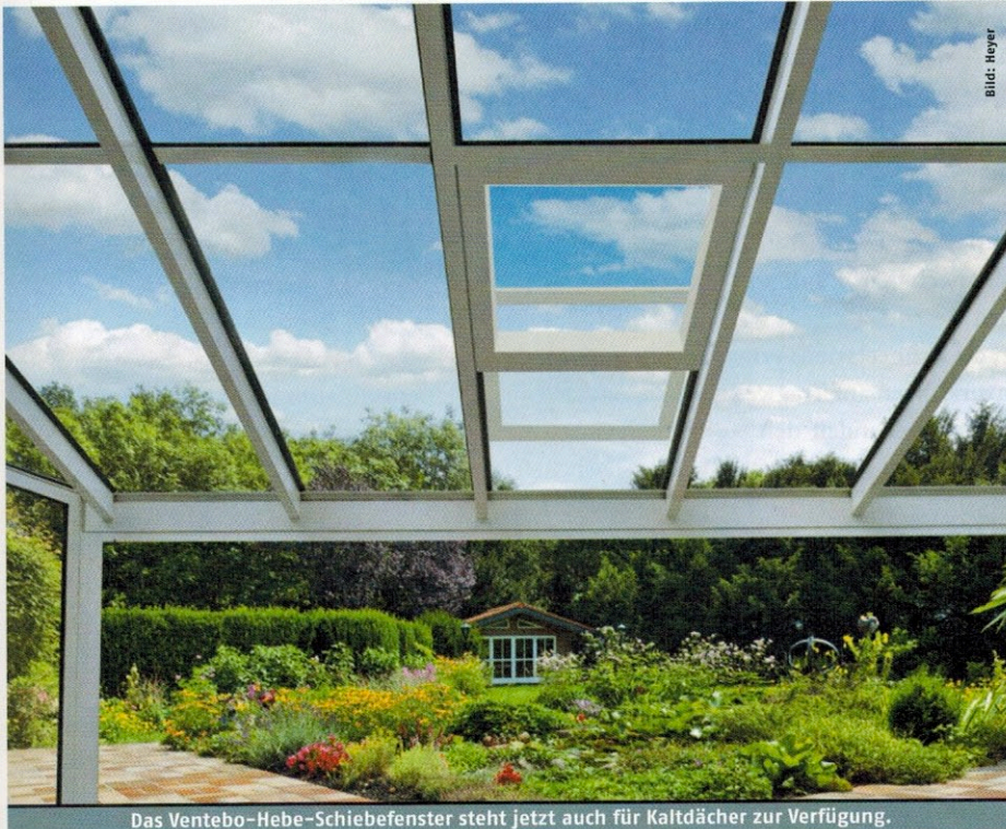
Das Ventebo-Hebe-Schiebefenster steht jetzt auch für Kaltdächer zur Verfügung.

DIE ZUR FIRMA HEYER METALLBAU GEHÖRENDE MARKE VENTEBO HAT DAS GLASSTÄRKENANGEBOT IHRES HEBE-SCHIEBEFENSTERS ERWEITERT. ES IST NUN AUCH FÜR KALTDÄCHER LIEFERBAR.